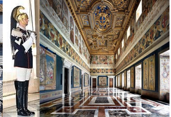
Palazzo del Quirinale